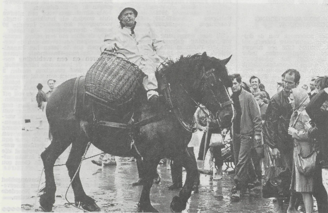
In de Westhoek zijn talrijke toeristen reeds vroeg in de morgen op het strand, om de kriegers te paard hun garnalen te zien vangen.

Zondag 20 juli wordt te Zeebrugge de Dag der Zeelieden Oostkust gehouden. Burgemeester Van Maele zal te 16 uur een krans neerleggen aan het Visserskruis terwijl ZEH Schoenmakers aldaar de Zeewijding zal opdragen. Te 16.30 uur is er in de Vismijnstraat een Standwerkerswedstrijd en te 18.30 uur gaat in de vismijn een avondfeest door met de medewerking van het Tiroler Dans- en Showorkest. Edelweiss en de Heistse Visbakkers. Deze plechtigheid gaat uit van het Feestcomité met steun van de stad Brugge en het bestendig comité ter Bevordering van de Visserijbelangen van Zeebrugge.