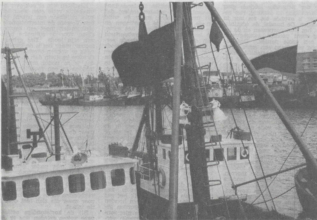
Het gaat de visserij sedert geruime tijd niet meer voor de wind. Vandaar dat men te Zeebrugge zelfs de zwarte vlag hees. Hoelang nog zullen onze reders de boeg boven water kunnen houden?