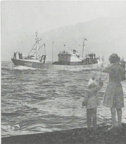
„Itxaso“ : Spaanse vissers- boot - 8MDXC 1080 pk - 750 rpm