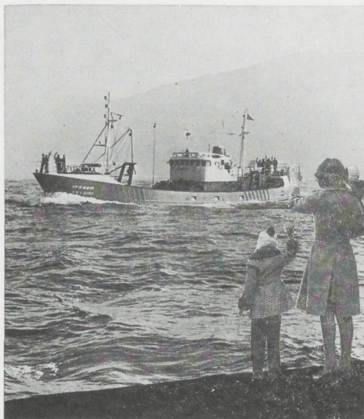
„Itxaso“ : Spaanse vissers- boot - 8MDXC 1080 pk - 750 rpm