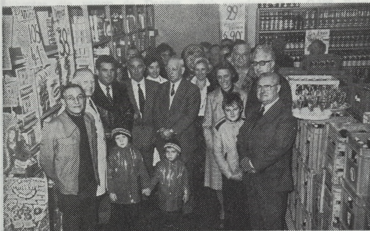
Enkele beelden van de opening van de SCAP-DISCOUNT, nog een pluin op het uitgebreid verkoopsprogramma van deze Oostendse rederscoöperatieve.