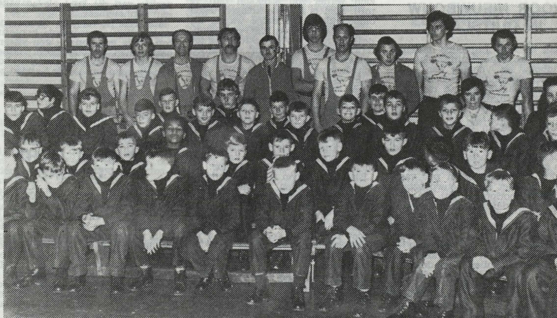
Olympic Krachtsport Oostende pakte bij de IBIS-boys uit met een zeer gewaardeerde demonstratie-meeting ! Achteraf konden de stoere Ibis-knappen zich ook even aan de halters wagen..... maar willen en kunnen, da's 2 ! Maar 't sukses voor de Olympicbonken bleek er niet minder om, integendeel !