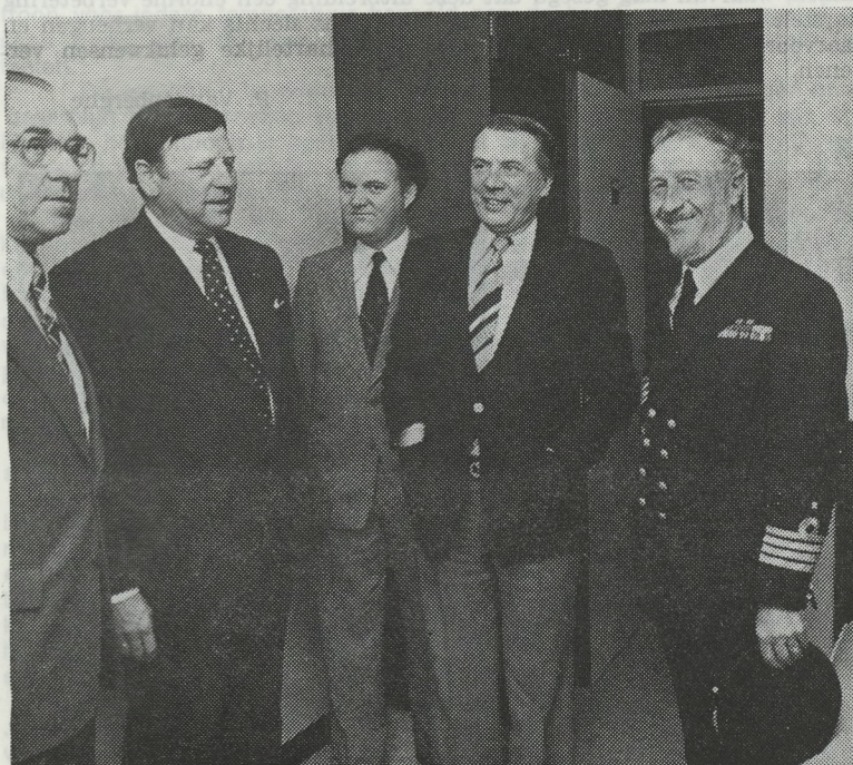
De prominenten die tegenwoordig waren op de plechtigheid.