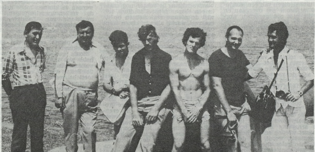
Oostendse vissers te Dakar. Gebruik makend van de rustperiode trekken bij op toeristentoer.