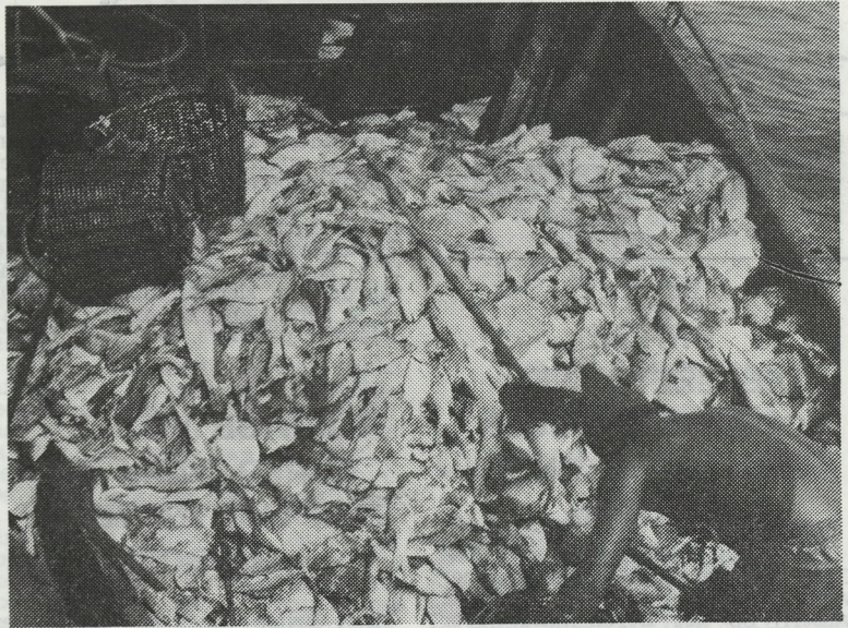
De kuil wordt gelost en een massa vis verspreidt zich over het dek.

In Sénégal kost een vrouw 26 duizend Belgische F (165 duizend Sénégalense frank). Men wendt zich tot de ouders met het geld en deze richten dan een hut in voor het paar. Zes en twintig duizend F is zeker niet te veel als men nagaat hoe kostelijk hier een vrouw is, allé, kwestie van onderhoud, kleren, coiffeur en koffie met taartjes. Wanneer het niet te goed botert, kan men in Sénégal eenvoudig een verklaring afleggen aan de overheid en dan neemt de familie de vrouw terug. En dan zegt men dat men in deze landen niet geëmancipeerd is. Daar komen wij mannen, hier nog een aardig stukje in te kort. B