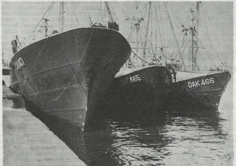
De drie gewezen Oostendse treilers, nu in volle bedrijvigheid in het verre Senegal.