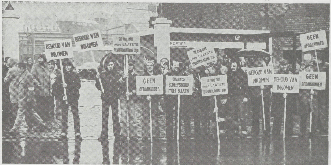
De betogende werknemers van de scheepswerven Beliard Murdoch die zich ernstig bedreigd voelen in hun bestaan.

werkende per week, behoren van gans de wereld?