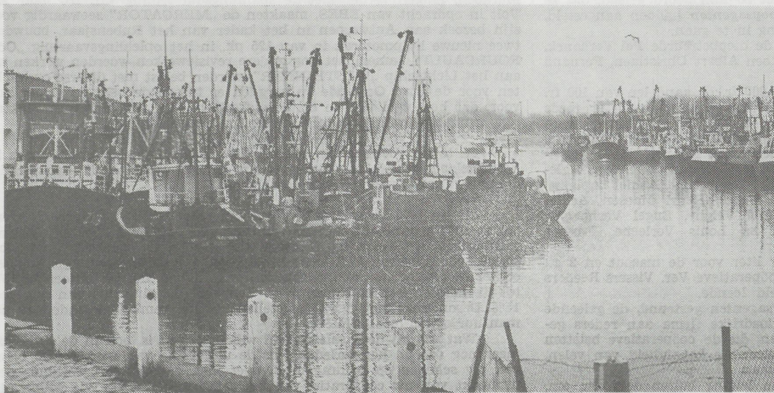
Rond deze tijd van het jaar is het voor het grootste gedeelte van de Zeebrugse vissersvloot voor een paar dagen dolce far niente geblazen. De zo harde visserstiel wordt dan op een zijspoor gerangeerd want carnaval vieren staat centraal en wie dat ooit aan de Oosthoek meemaakte weet dat die mannen er een handje van weg hebben

Hiermee eindigde deze welgeslaagde vergadering overtuigd dat hier een maatschappij in haar zeer nuttig bestaan verlengd werd en de reders meer en meer het groot belang er van zullen begrijpen.