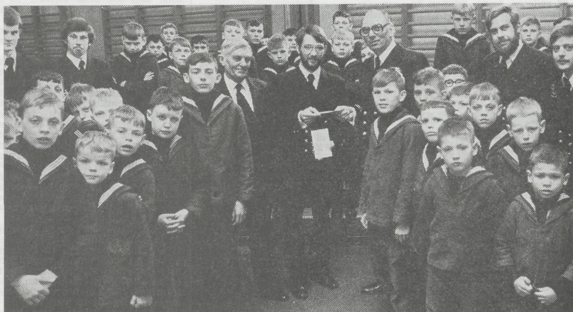
«Argonaut», de Vereniging van de studenten van de Hogere Zeevaartschool te Antwerpen, bracht ook dit jaar een bezoek aan de vrienden van de Ibischool. Tijdens een gezellige bijeenkomst, werd aan de directie een check overhandigd ten voordele van het «Nieuwbouwfonds».