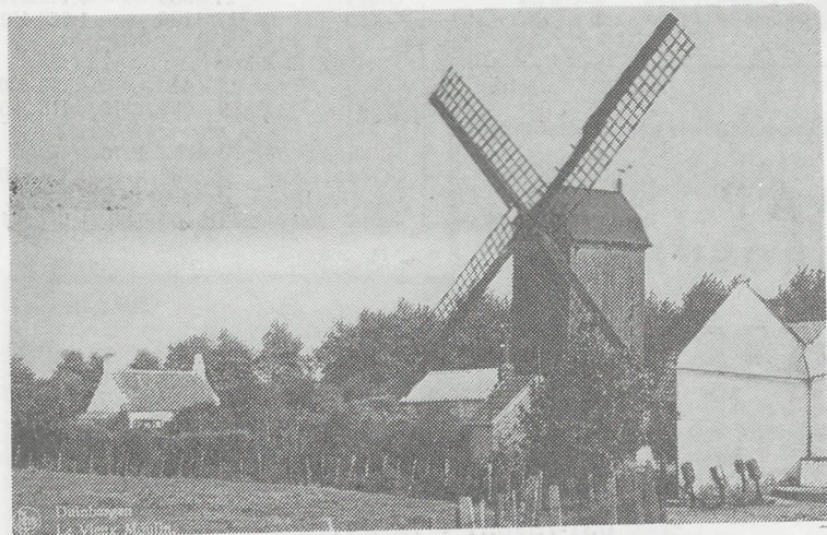
De molen van Loojje Maeckers in Duinbergen door Bogaert van de Franco-Belge, gefotografeerd en verspreid. Een Brusselse droom-inspiratie !

Indien er een verwerkingsindustrie komt, hetgeen bijna zeker is, vermits de afzet gewaarborgd is, zullen de produkten bestemd zijn voor de Russische markt. Het is duidelijk dat Rusland hier een zeer goed punt scoort, vermits hun schepen de toelating verkrijgen om vóór de Marokkaanse en de Marokkaanse-Saharakust te komen vissen. Het is natuurlijk gemakkelijker voor een land dat hiervoor staatskapitaal kan inzetten, om tot dergelijke overeenkomst te komen. Dit is moeilijker te verwezenlijken voor landen waarvan het initiatief bijna uitsluitend van uit een private hoek moet komen, en waar de eigen regering alleen bereid kan gevonden worden haar goede diensten te verlenen. Voor de Russische visserij is dit in ieder geval een zeer tastbaar resultaat, omdat ze hierdoor niet alleen terug deze rijke visserijgronden mogen gaan bevissen, maar daarbij verlost zijn van de vroegere zware Spaanse, Franse, Japanse en andere konkurrentie. Ook politiek gezien betekenen deze investeringen en het inhalen van Russische onderzoekers en techniekers in Marokko, een goede beurt voor de Sovjet-Unie. Men kan inderdaad ook een land in een bepaalde invloedssfeer halen langs economische weg en dat weten de Sovjets bepaald goed en daarom hebben zij altijd meer te bieden voor het afsluiten van dergelijke overeenkomsten dan andere landen.