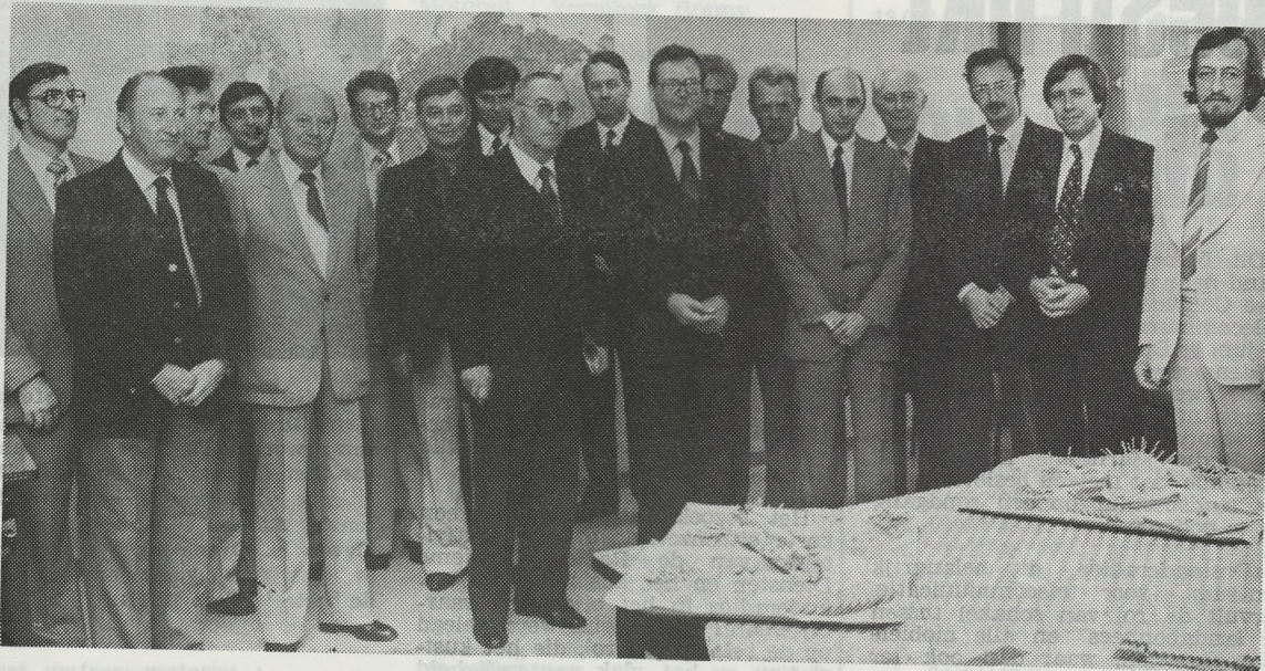
De Radio Maritieme Diensten te Oostende beschikken over een uitermate knappe technische en administratieve leidinggevende ploeg : stuk voor stuk mensen met zeer grote ervaring en bestendige toewijding. Een droom van een dienst in een droom van een lokalenkompleks !