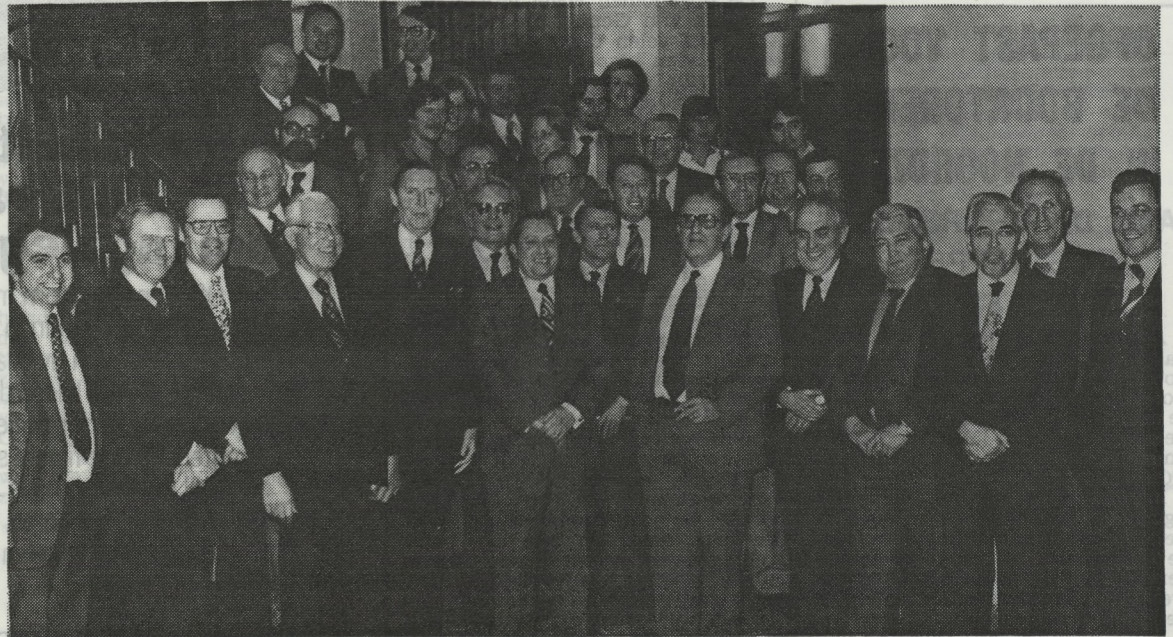
Niets dan glunderende gezichten bij de bestuursmensen van het Nationaal Verbond van Visventers en hun vele genodigden tijdens de ontvangst op het Oostendse stadhuis.

Nadat Kabinetschef Vermassen , Minister Lavens had verontschul-