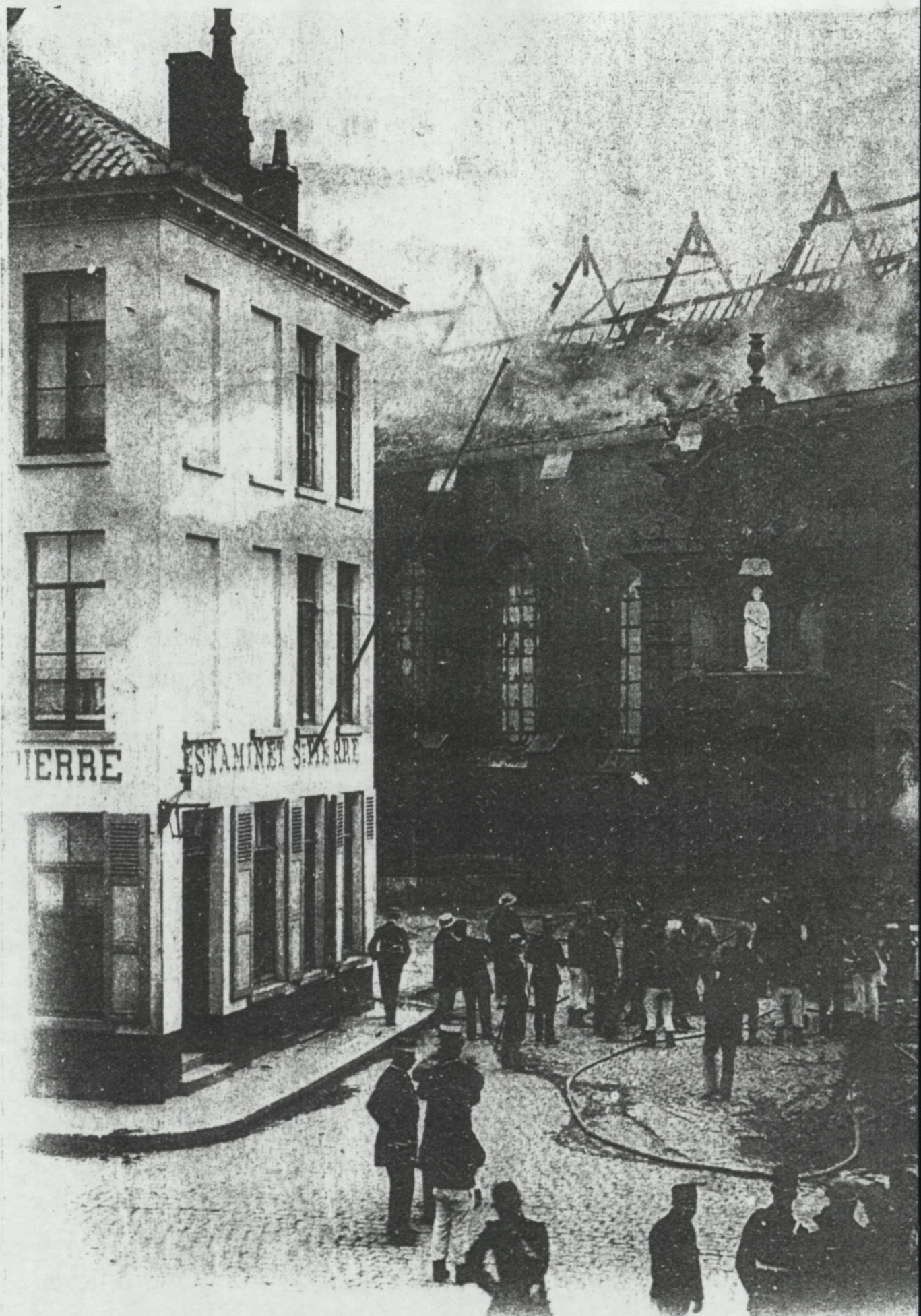
Incendie de l'église des S.S. Pierre et Paul le 14 Août 1896, Osten Prière de nous faire dire si l'ou ve au Cercle ce soir? Amis