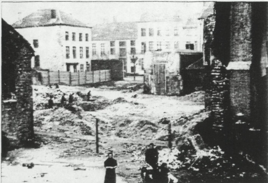
Tijdens de afbraak van de afgebrande kerk, links de opgetrokken noodkerk, rechts de 'Peperbusse', zicht richting Jozef II-straat.

Tal van beweringen werden de wereld ingestuurd. Zo werd er onder meer ten stelligste verzekerd dat rond de middag van die bewuste vrijdag, toen de rook nauwelijks door