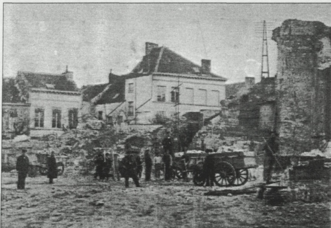
Afbraakwerken afgebrande kerk