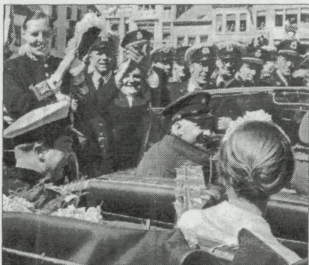
Bij de ontvangst van Prins Albert en Prinses Poala. Een breed glimlachende Albert (derde van rechts)

Bij de verkeersbrigade was ik ook tekenaar, dat wil zeggen, ieder accident, ieder geval, moest op een plan geschetst worden voor het parket. In die tijd hadden we wel soms last met de Engelsen. Eén keer zelfs met een stuk of 40 van hen, het was zelfs zo erg dat ik mijn matrak erop kapot geslagen heb.