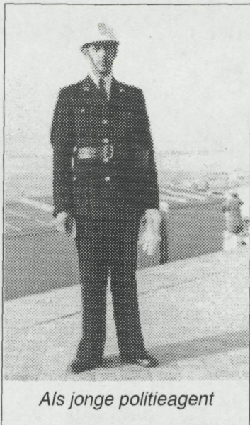
Als jonge politieagent

politie, examen meegedaan en op 1 maart 1945 begon ik als agent op het Catherinaplein. Wij waren bij de politie van Oostende maar hadden die buurt onder ons. Wij behoorden tot de "cyclisten", de bereden politie te voet, want alle vélo's waren opgeëist!