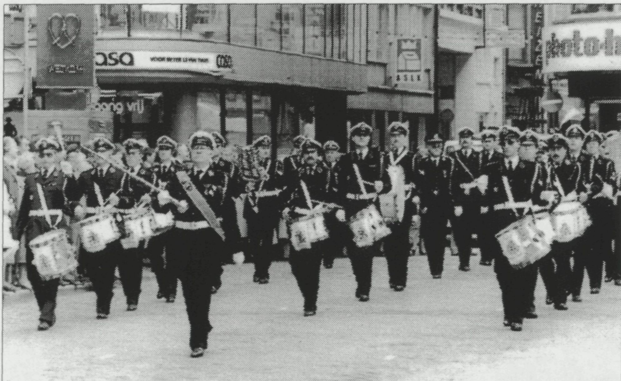
Een fiere tambour-major op de Dag van de Politie (1985)

We hadden vóór we trouwden al over een kelder op het kerkhof voor ons tweeën nagedacht, maar wel op een plaats die we voordien al uitgezocht hadden. Toen we naar het stadhuis gingen om onze trouw aan te geven hebben we dan tegelijkertijd de plaats op het kerkhof gekocht: dit is waarschijnlijk nog nooit in Oostende gebeurd. Maar we weten nu dat dit in orde is moest er iets gebeuren met ons.