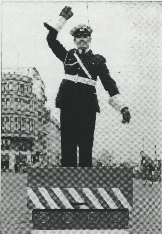
Verkeer regelen van op "de bak"