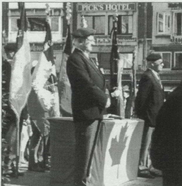
Op de herdenking 50 jaar Vrede

Als politie hadden we geen recht van staken. Iedereen van de politie was in dienst met