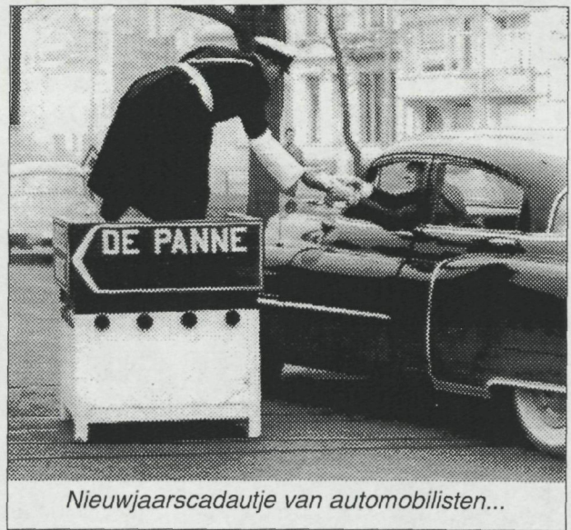
Nieuwjaarscadeautje van automobilisten...

eerste hulp behaalden. Tijdens de les had ze iemand nodig die in bed lag en ik was dus de patiënt en zij had mij vast en ik had haar vast en het was gebeurd. En dit alles voor 52 leerlingen, die zaten te kijken. Vanaf 1951 zijn we dan samen gaan wonen in de Koningstraat. Daar woonden we acht jaar, van daar naar de Jozef-II-straat en nu wonen we in de Zuidstraat.