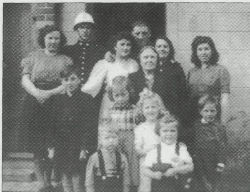
Foto als soldaat met familie, juist na de oorlog, met moeder, dochter, zoon en familieleden.

Ik werd soldaat de derde januari 1939 in de derde linie te Oostende. In september zijn we dan te velde gegaan, want er was mobilisatie. We waren aan het Albertkanaal en de elfde mei moesten we van daar weggaan. We werden daar gebombardeerd. Toen hebben we een heel eind te voet afgelegd tot in Poperinge, dan van Poperinge tot Kortrijk en dit was het einde van de oorlog voor ons. De 28ste mei zou ik van de