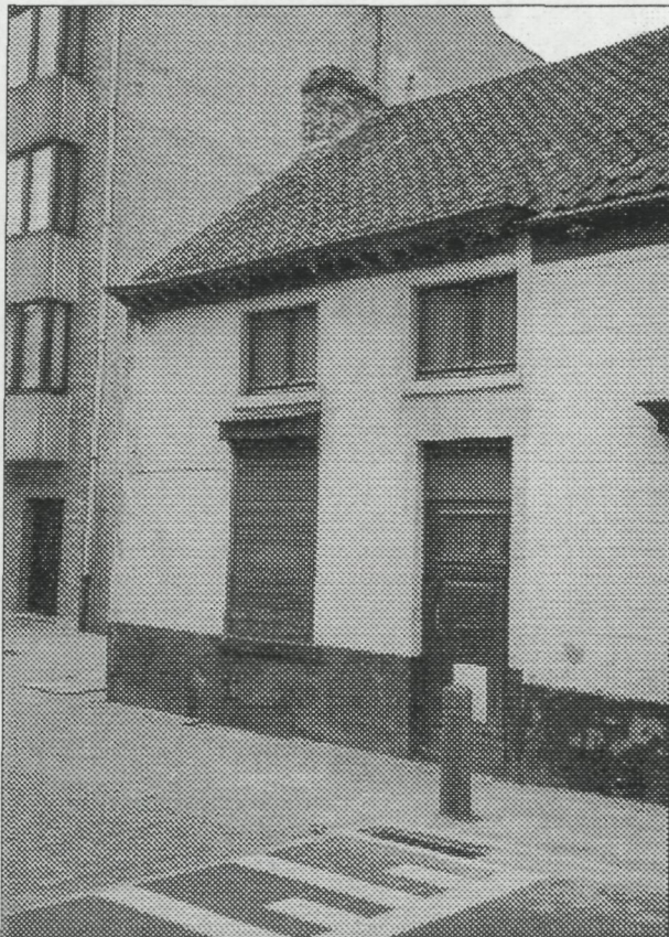
Een van de resterende "garrehuisjes"

Garren zijn gelukkig voltooid verleden tijd.