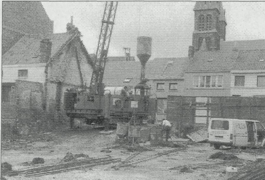
Aan de linkerzijde merkt men nog duidelijk de "rampe"

loop nemen om voorbij de boog te geraken. Daarachter was een 'rampe' (schuine helling). Bij wateroverlast hadden deze bewoners, gezien het laaggelegen gedeelte, iedere maal prijs. We mogen niet vergeten dat de bedding van de oude kreek daar ook lag. Het moet er geen lachertje geweest zijn.