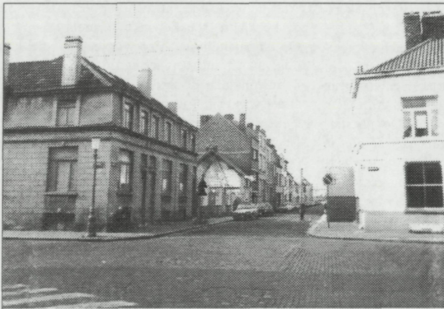
1983: de huisjes van de garre zijn al afgebroken

konden worden. Sommigen gaven ook eten aan deze huurders. Maar dat was een minderheid.