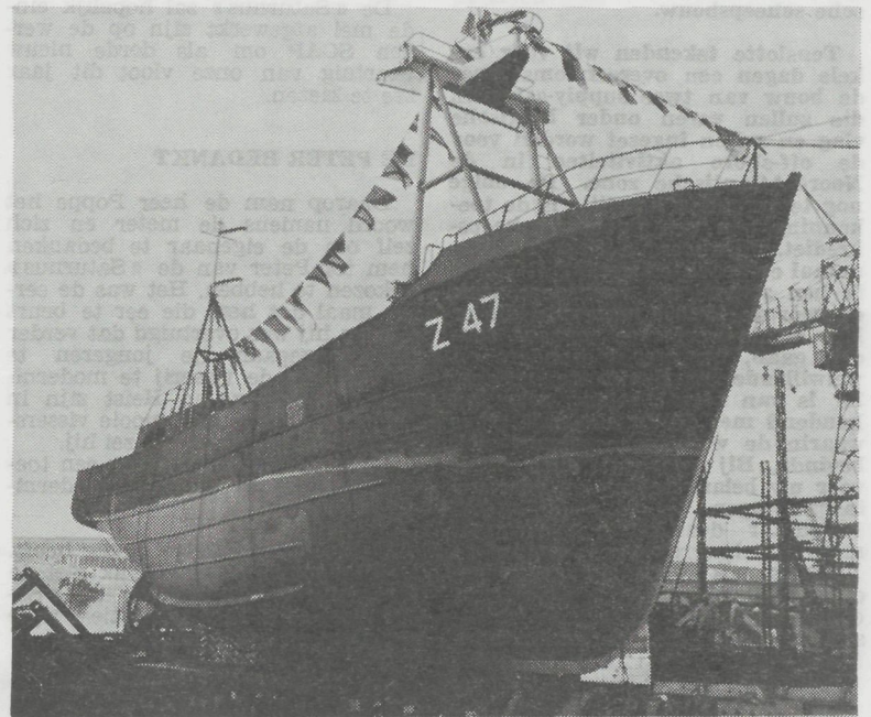
De stoere aanwinst voor de Zeebrugse vissersvloot de Z.47 «Saturnus» even voor de stapelloop.

Aalmoezenier Cornellie doet zijn, per traditie aan een doopplechtigheid gekoppelde toer, rond de kloeke «Saturnus». Geassisteerd door «Koster» Jef Deroose maar dat zegden enkele stouterikken onder de aanwezigen.