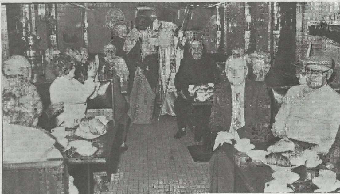
De pas opgerichte vereniging «De Moats van de Sailorsclub» hebben een eerste initiatief achter de rug. Eind vorige week werd door deze filantropische vereniging een Klaasfeest georganiseerd met als voornaamste gasten de kostgangers van het Zeemanstehuis Godschalck. Het werd voor de oudjes een erg leuke namiddag.