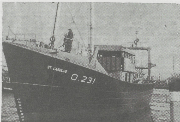
DE O.231 « ST. CAROLUS »