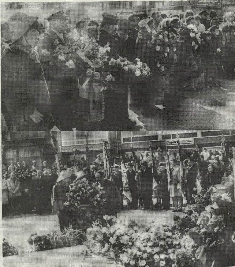
Nog twee beelden van de plechtigheid der jaarlijkse Vissershulde, die zowel de kustmensen als de toerist steeds recht naar het hart gaat.

Robert Rycx, die in het stadhuis al heel de problematiek in al zijn scherpte had geschetst, voegde