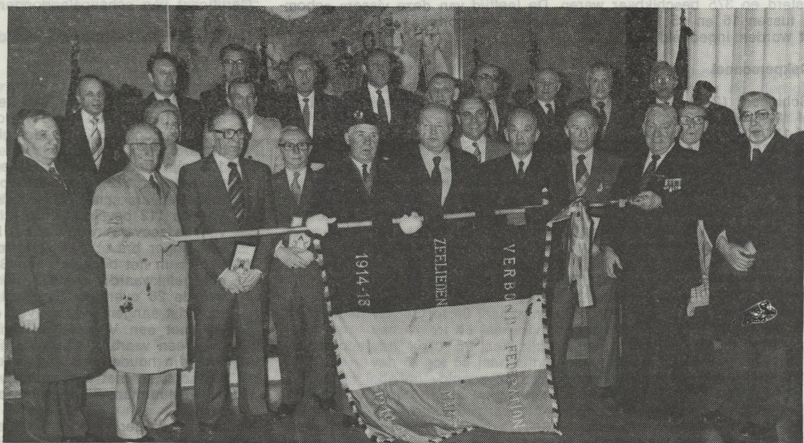
NIEUW VAANDEL VOOR ZEELIEDEN — Gepaard met de traditionele bloemenhulde aan het monument der zeelieden waar hulde werd gebracht aan de overleden vissers werd in het stadhuis een nieuw vaandel overhandigd aan de Federatie der Belgische Zeelieden van de oorlogen 1914-18 en 1940-45. Tijdens deze ontvangst werden ook enkele verdienstelijke bestuursmensen met een plakket bedacht.

daar tijdens het feestmaal nog een en ander aan toe. Tijdens de eerste wereldoorlog hebben Belgische vissers 590 schipbreukelingen gered. «Decoratie taboe», zei de voorzitter, en die zinnene kwam als een refrain telkens terug na elk voorbeeld van bijna onvoorstelbare heldenmoed, door vissers betoond ook tijdens de tweede wereldoorlog.