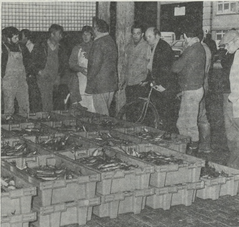
De eerste haring werd maandag aangevoerd door het span N.3-O.279. Mede door een levendige belangstelling die bij de kopers heerste werden zeer goede prijzen opgetekend maar... het was een nieuwtje.

Dit noemen we woekerwinsten. En waar is eens te meer de Rederscentrale die veel meer aan show doet om de Hogere Overheid daarop te wijzen. Hier is het eens temeer de reder en visser die het gelag betaalt.