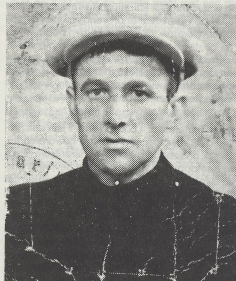
Tijdens de bezettingsjaren... Schipper van de Z.52 «Kompas»... met een «stempel» van de Kriegsmarine !

Wij hebben gezegd dat voor onze zeevissers en voor onze zeelieden ter koopvaardij de tweede wereldoorlog op 3 september 1939 reeds een aanvang heeft genomen. Voor onze zeelieden ter koopvaardij, die in de Stille Oceaan vaarden, moest de oorlog met de capitulatie van Japan op 2 september 1945 eindigen. Voor onze zeevissers is het gevaar nog langer in hun dagelijks leven gebleven. Na de bevrijding en zelfs lang na V-day van 8 mei 1945, zijn nog de volgende vissersvaartuigen op mijnen gelopen : op 22 december 1944 vóór Nieuwpoort, twee vaartuigen de N.48 met 5 doden en de N.59 met 3 doden (Heistse bemanning); op 21 januari 1945, de B.11 met 1 dode; op 4 februari 1945, de BOU.20 met 4 doden; op 19 februari 1945, de N.145, met 4 doden; op 27 februari 1945, de B.96 met 1 dode; op 12 maart 1945, de N.68 met 4 doden; op 20 maart 1945, de B.121 met 5 doden; op 28 maart 1945, de O.143 met 5 doden; op 10 april 1945, de O.303 met 4 doden; op 13 april 1945, de Z.8 met 4 doden; op 26 april 1945, de O.157 met 2 doden; op 31 juli 1945, de N.101 met 3 doden; op 2 augustus 1945, de B.65