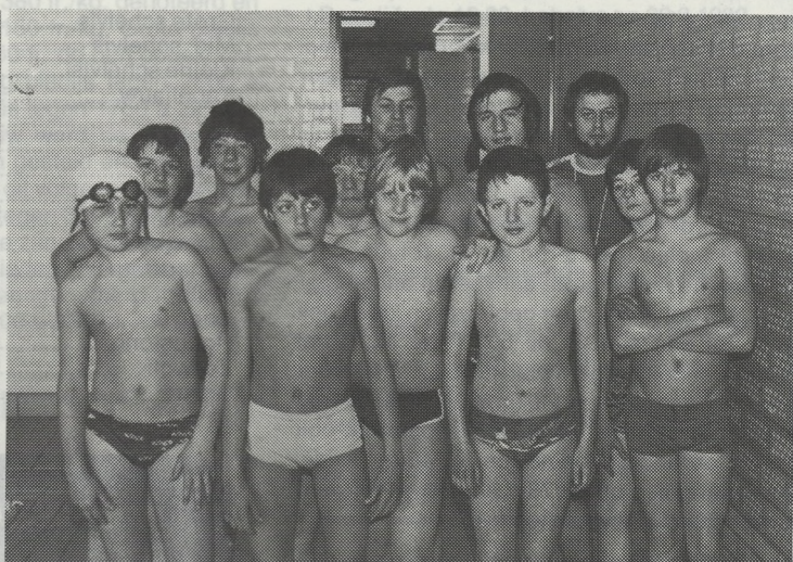
De knappe zwemmers van de Vrije Visserijschool uit Nieuwpoort