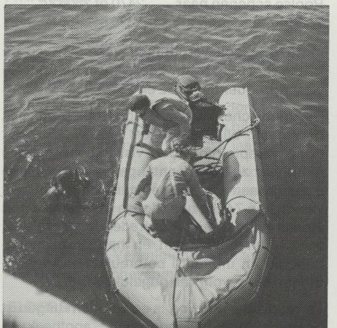
Een duiker van het HKS «De Hoop» aan het werk tijdens het verwijderen van een tros uit de schroef van een trailer.

Op 12 december 1963 was de stapelloop en de proefvaart was op 8 april 1964 en de overdracht op 14 april 1964.