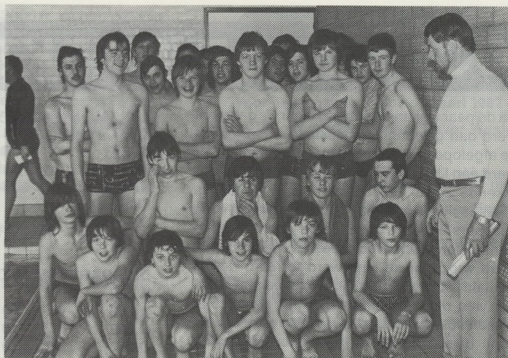
De ploeg van de Vrije Visserijschool «Paster Pype» uit Oostende