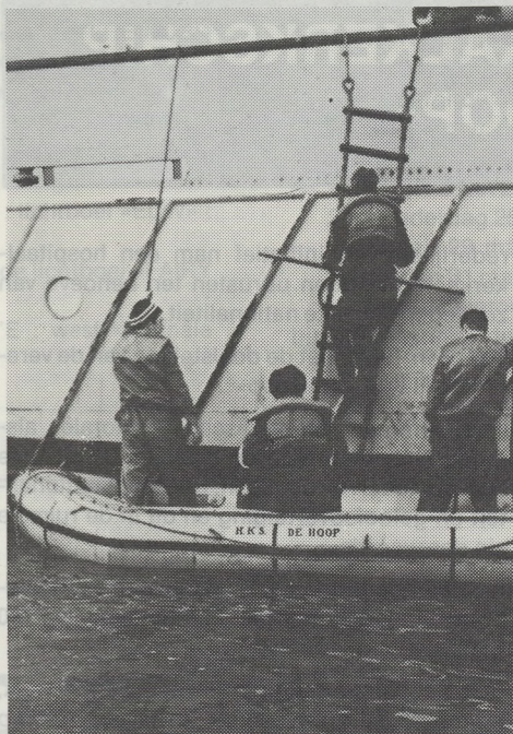
Langsij het vaartuig gemeerd ligt men wachtend om de patient aan boord te nemen.

Indien noodzakelijk kan operatief worden ingegrepen. Liever brengt men echter een dergelijke patient, in zijn eigen belang met spoed naar het dichtsbijzijnde grote ziekenhuis aan de wal.