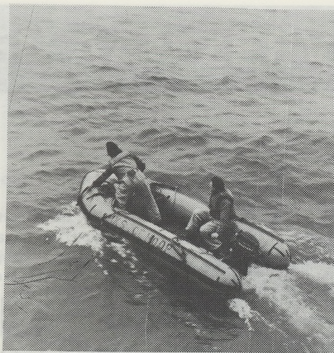
Bij middel van een rubberboot gaat men een patient ophalen van een vissersvaartuig.

De medische afdeling is een modern uitgerust hospitaal met behandelkamer, apotheek en röntgenkamer en beschikt over twaalf bedden verdeeld in 5 ziekenzaaltjes waaronder een iso-leerhut.