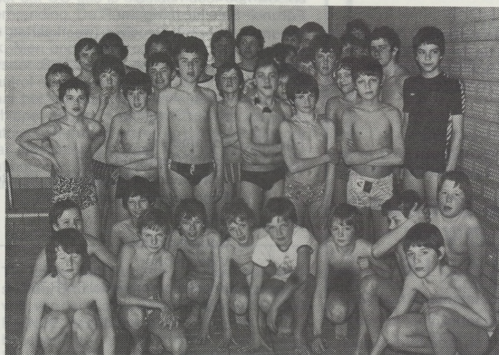
De ploeg van de Rijkvisserijschool Knokke-Heist