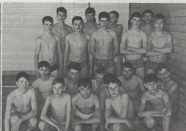
Het team van de Ibis