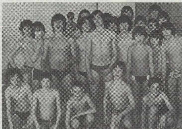
De formatie van de Stedelijke Visserijschool «John Bauwens» uit Oostende