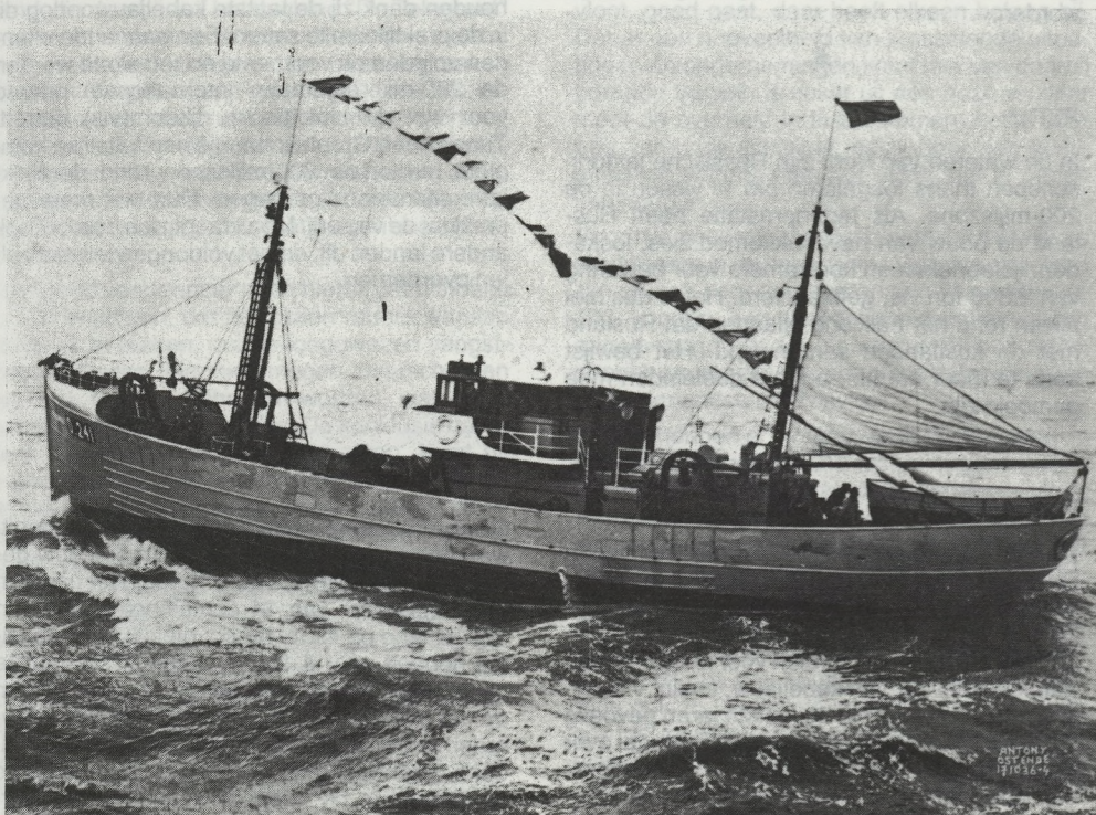
De O.241 «Providentia»

Isidoor-Alex Vieren (De Panne - 7 augustus 1905); Guillaume Zonnekeyn (Nieuwpoort - 21 juli 1908); Louis Defer (Oostende - 3 november 1909); Gaston Wijnants (Dampremy - 9 januari 1907); Gustaaf Hubrouck (Oostende - 11 augustus 1914); André Verbrugge (Oostende - 13 januari 1912).