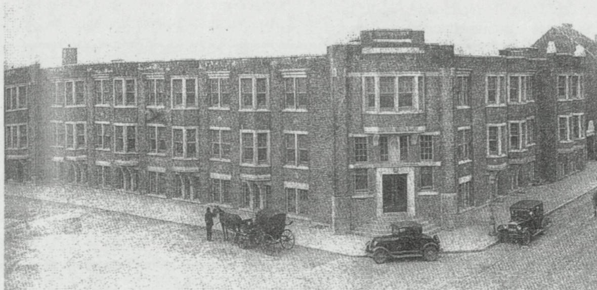
Voorgevel H.Hartkliniek circa 1950