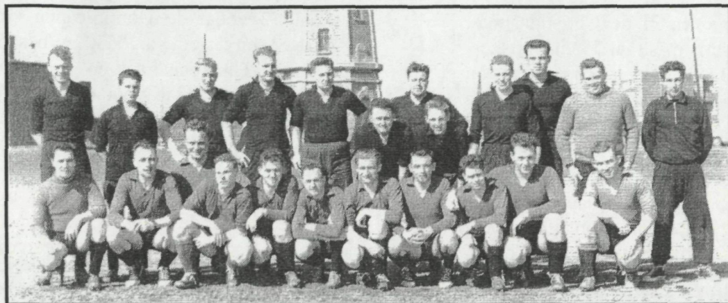
Voetbalmatch 25 april 1958 Officieren– Onderofficieren: 2-1 Wie herkent op de bovenste rij, 2 leden van Lange Nelle?

Zij voeren gepland groot en klein onderhoud en herstellingen uit, bouwen nieuwe constructies enz.