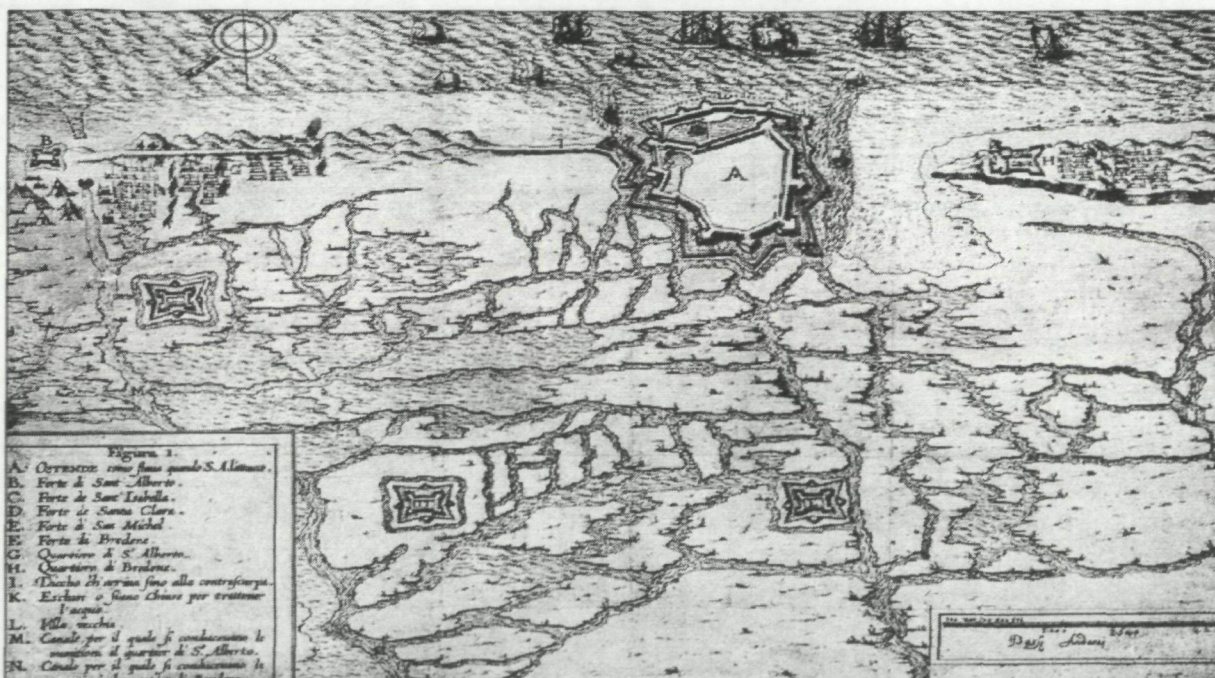
Afbeelding 3: plan dat goed de gevolgen laat zien van het doorsteken van de duinen ten oosten van de stad.

Kopergravure van Gioseppo Gamurini, uit 'Delle Guerre di Fiandra' van Pompeo Giustiniano. (Uitgever Joachim Trognese, Antwerpen 1609).