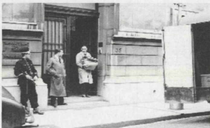
Bewaakt geldtransport NBB, Kaaistraat 35 Oostende, 14 december 1956