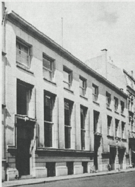
NBB Kaaistraat, 8 mei 1952,

Onmiddellijk na de oorlog kende het agentschap een drukke activiteit bij de uitvoering van de "Gutt-operatie". In oktober 1944 werden alle in omloop zijnde bankbiljetten van 100 frank en meer niet langer meer als betaalmiddel aanvaard en moesten ze omgeruild worden tegen nieuwe biljetten die tijdens de oorlog in Londen waren gedrukt. Elk gezinslid kon maximaal voor 2000 frank nieuwe biljetten krijgen. Wie meer aangaf, zag zijn geld geblokkeerd. Later kwam er een geleidelijke omwisseling en teruggave maar wie een onvoldoende verklaring had voor de herkomst van het ingeleverde geld kreeg een boete wegens belastingfraude of wegens oorlogswinsten