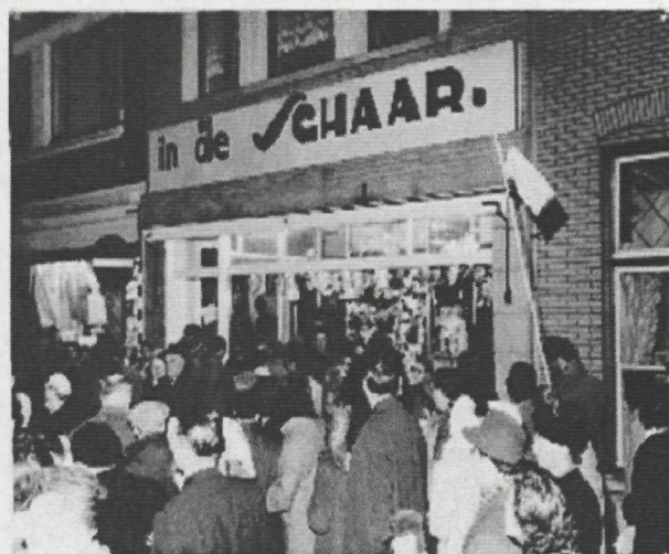
Carnavalsoptocht voor "In de schaar",

Het gebouw naast de deur konden we kopen op voorwaarde dat we de winkel (de Zulle) overnamen en de marchandise ook. Dat waren de soutiens en corsees van Madamtje Declerck. Noodgedwongen moesten wij dus corsees en soutiens verder verkopen.