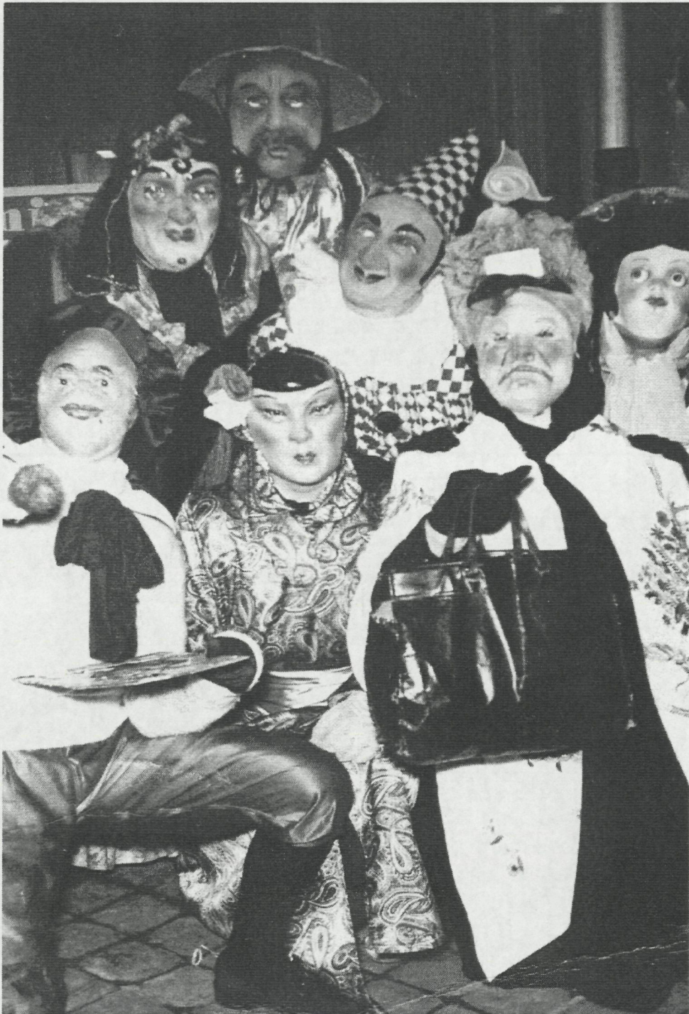
Familie- en vriendenmaskers tijdens carnaval februari 1952

Ik ben nu 85 jaar maar nog actief. Verscheidene jaren was ik ondervoorzitter van NEOS (vroeger CRM) en vaak organiseerde ik wandelingen. Ik heb 3 kinderen, 5 kleinkinderen en 5 achterkleinkinderen. Nooit heb ik me verveeld en ik had een heel gevuld leven.