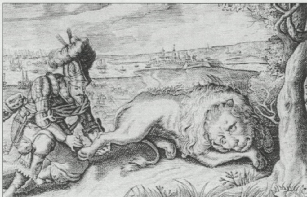
Afb. 9 Spinola verwijderd de doorn uit de poot van de Leo Belgicus; Oostende in de achtergrond (stadsarchief Oostende)

Op 29 september 1603 sluit Ambrosio met Filips III en Albrecht een overeenkomst dat hem het opperbevel over het leger te Oostende oplevert, in ruil voor de financiering van het beleg. Vanaf 8 oktober neemt Ambrosio het opperbevel over. Hij zorgt voor een nieuwe impuls in het Spaanse kamp: de orde wordt hersteld, de soldij betaald. Hij verandert ook de tactiek. De aanvallen zijn niet langer gericht op de Oude Stad, maar gesteund door superieure vuurkracht wordt er voortdurend storm gelopen op de zuidelijke wallen.