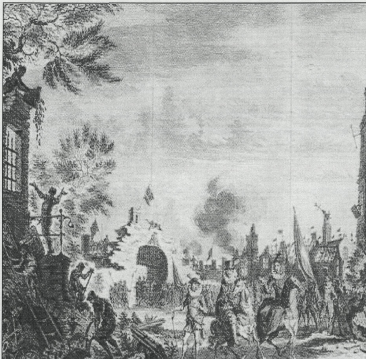
Afb 12: Oostende. Intocht op 3 oktober 1604 van de aartshertogen Albrecht en Isabella, kopergravure getekend: S. Fokke, uit J.Wagenaar, Vaderlandsche Historie. 1749 Oostende, Stadsarchief, PT/D 23, privéverzameling auteur.