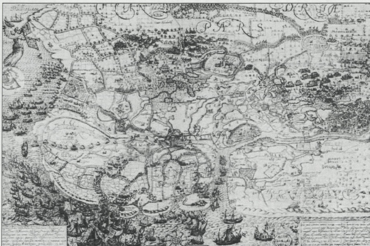
Afb 10: verovering van Sluis, 1604, gravure van Floris Balthasar, Univ. Bib. Leiden, coll. BN P37