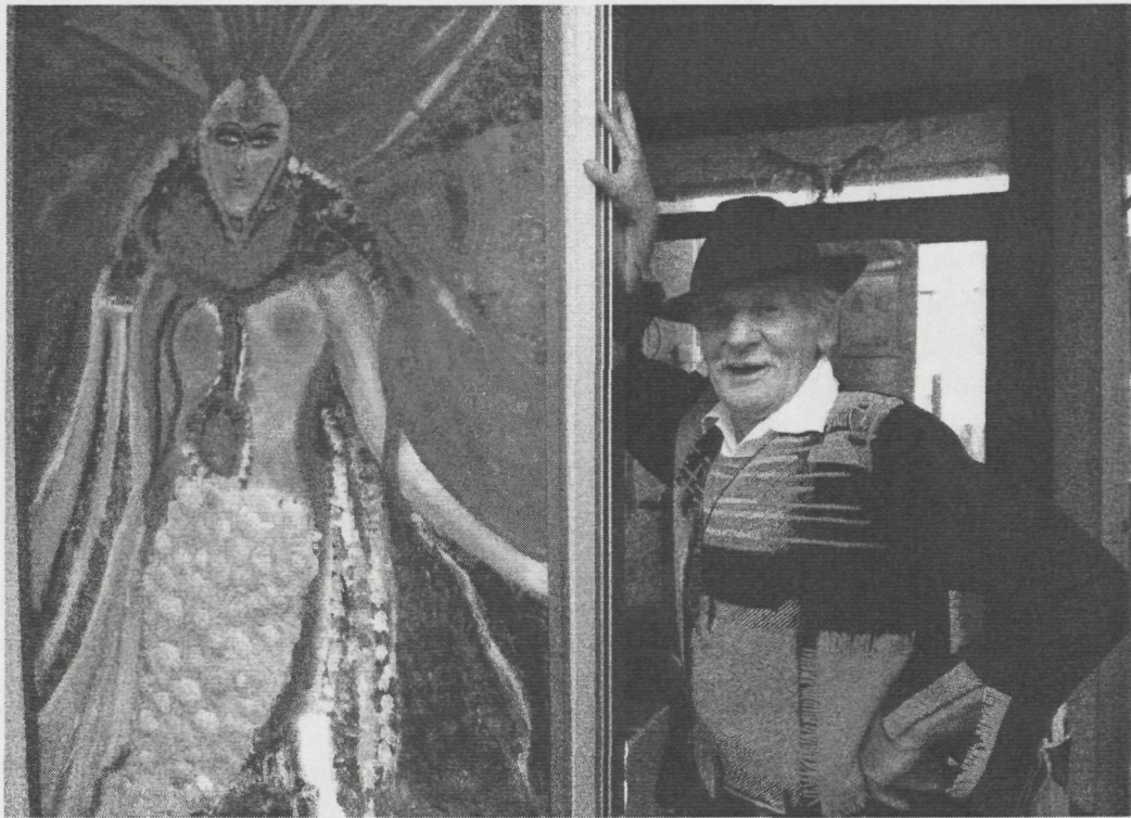
De Zeemeermin van zand, schelpen en acryl