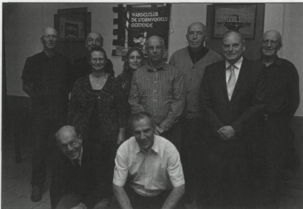
Foto genomen bij de viering van het 40 jaar bestaan

Daarom werd op de algemene vergadering van augustus 2014 de spijtige beslissing genomen om per 1 januari 2015 definitief te stoppen met alle wandelactiviteiten en de vzw te ontbinden.