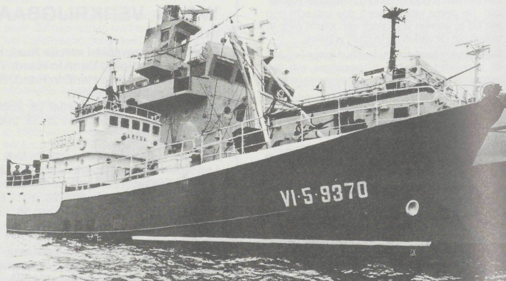
De Spaanse treiler „Garysa” aan de kade te Falmouth naast de „Leeds castle” (Foto Fishing News, Highway House 87, Black Friars Road, Londen SE1).

Dit heeft echter de Falmouth-magistraten niet tot veel toegeeflijkheid kunnen overhalen. De Spaanse schipper zelf verliet dan ook duidelijk getekend de gerechtszaal.