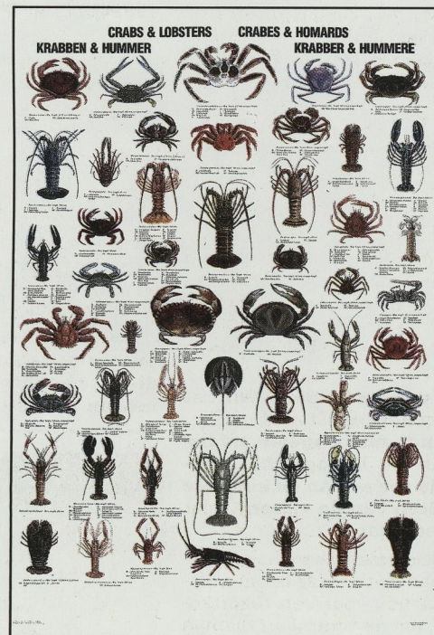
TYPE L: krabben en kreeften.

51 soorten krabben en kreeften met aanduiding van de grootte.