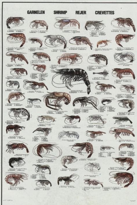
TYPE I: garnalen.

Die vismappen zijn verkrijgbaar voor de prijs van 500 fr. 't stuk + 110 fr. verzendingskosten ter drukkerij „Nieuwsblad van de Kust”, Hendrik Baelskaai 30, te 8400 Oostende - ☎ (059) 32 11 13