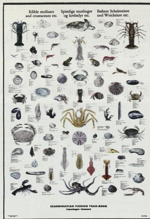
TYPE D: Eetbare mosselen en schaaldieren, enz.

75 verschillende soorten van de hele wereld. De namen staan in het Latijns, het Nederlands, het Italiaans, het Portugees en het Frans.