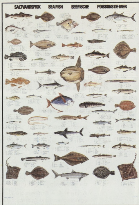
TYPE C: Zeevissen.

62 van de meest verspreide vissen van de Atlantische Oceaan en de Europese Zeeën. De namen staan in het Latijns, het Deens, het Noors, het Zweeds, het Engels, het Duits, het Frans, het Nederlands, het Italiaans, het Portugees en het Spaans.