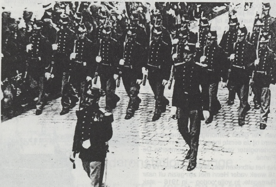
De burgerwacht die in de straten van Oostende patrouilleerde.

De Belgische bevelhebber moest aan zijn vreemde collega's ieder inbreuk op de reglementen door een schip van zijn nationaliteit kenbaar maken, en alle gegevens verstrekken, waarin de commandant zou kunnen belang stellen.