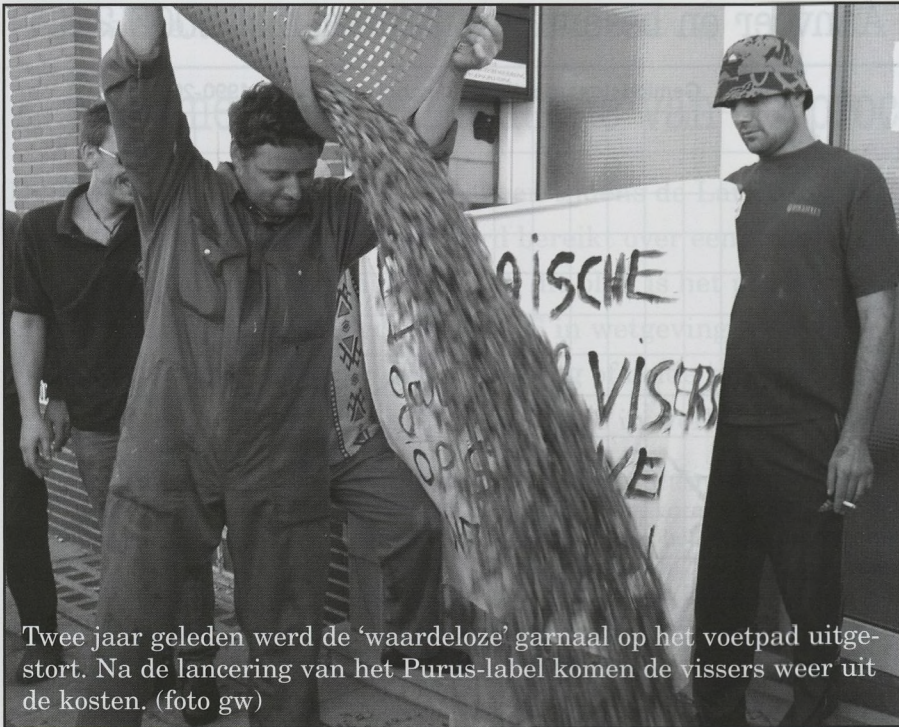
Twee jaar geleden werd de 'waardeloze' garnaal op het voetpad uitgestort. Na de lancering van het Purus-label komen de vissers weer uit de kosten.