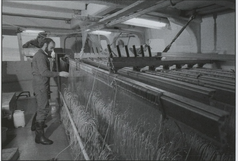
Stockerrek voor de lange vislijnen voor de longline-visserij.

I N APRIL 1983 liet de toen bekende Firma Valcke Frères de visserij kennismaken met de longline-vistechiek. Een kleine Noorse treiler werd naar Oostende gehaald om de werking te demonstreren. Videobeelden die aan boord werden getoond lieten vermoeden dat er brood zat in de long-linevisserij. Bij de Noren is de gemechaniseerde lijnvisserij al op ruime schaal in de praktijk gebracht. Bij ons was deze visserijtechniek zo goed als onbekend. De Firma Valcke Frères wilde wel meewerken aan de introductie en commercialisering van de lijnvisserij. Binnen de SV Long Liners werd samengewerkt met de Noorse machinefabrikant Mustad. De eerste klant was de sportvisser Achilles IV van de familie Hinderickx, later de O.278 Longliner I, die het Mustad-systeem liet plaatsen. Bij de nieuwe visserijmethode