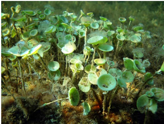
Fig. 7. Acetabularia crenulata . Foto: José Espinosa.

Acetabularia crenulata J. V. Lamouroux (Fig. 7)