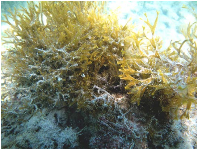
Fig. 1. Canistrocarpus cervicornis .

Canistrocarpus cervicornis (Kützing) De Paula & De Clerck (Fig. 1)