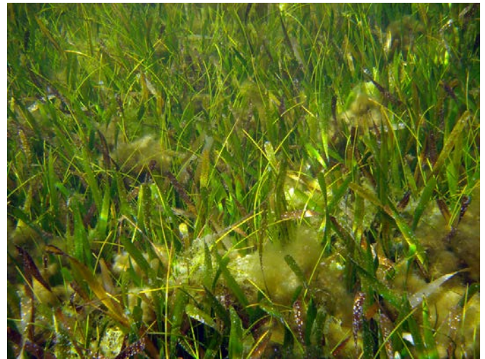
Fig. 8. Pastizal mixto de Thalassia testudinum y Syringodium filiforme .

Halophila engelmannii Ascherson Thalassia testudinum K. D. Koenig (Fig. 8)