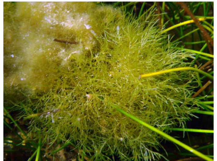
Fig. 6. Cladophoropsis macromeres y otras macroalgas sobre S. filiforme .

Cladophoropsis macromeres W. R. Taylor (Fig. 6)