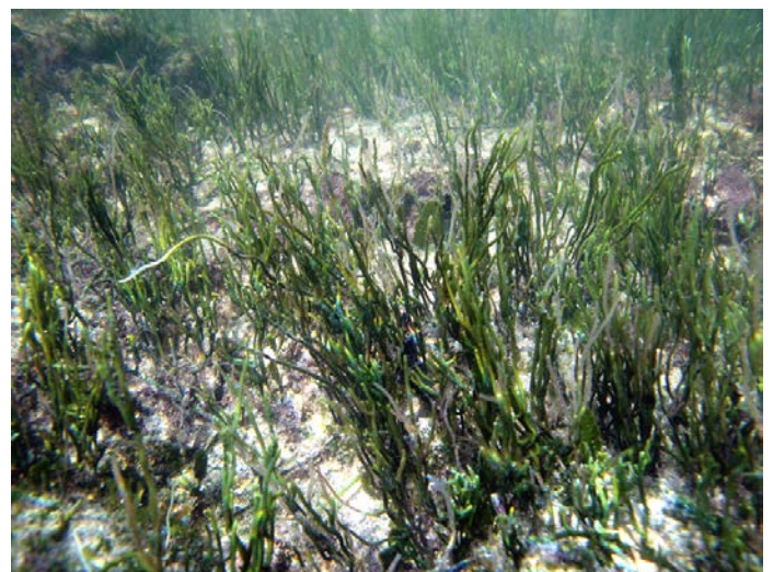
Fig. 3. Caulerpa cupressoides f. denudata . Foto: José Espinosa.