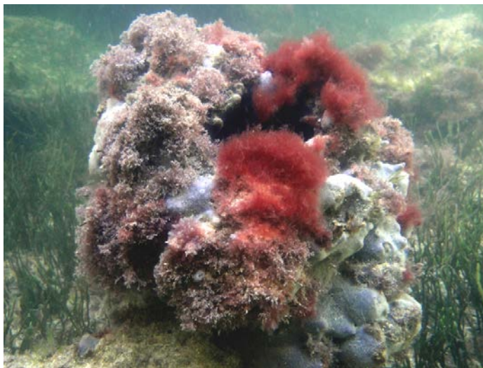
Fig. 10. Varias especies de rodofíceas sobre sustrato rocoso.

fangoso hasta arenoso) acompañando las angiospermas marinas, formando grandes acumulaciones sobre las mismas (Fig. 9), o fijas sobre cualquier sustrato rocoso junto a otros organismos del bentos (Fig. 10).