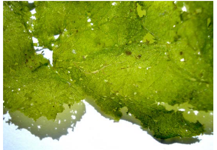
Fig. 5. Acercamiento a una fronda de Anadyomene saldanhae .

Anadyomene saldanhae A. B. Joly & E. C. Oliveira (Fig. 5)