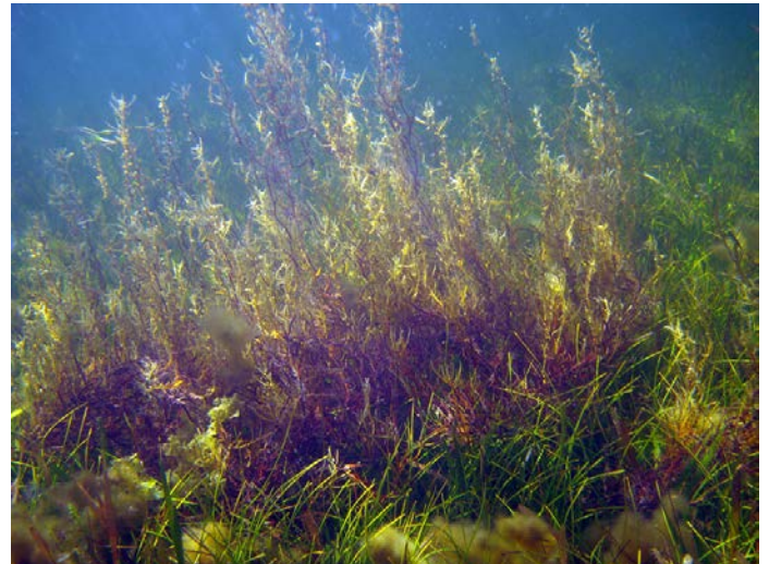
Fig. 2. Sargassum pteropleuron .