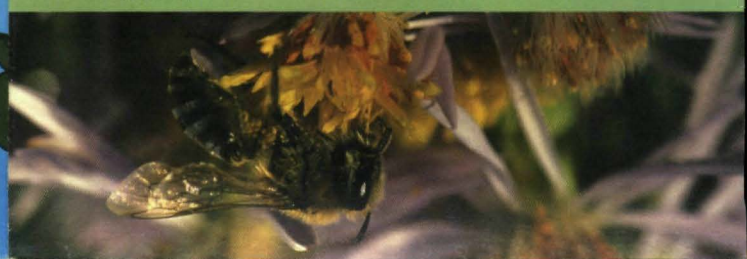
▲ schorrijd bij op zeesaai