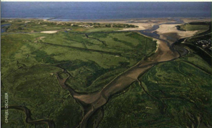
▲ luchtfoto van het Zwin

Het ZTAR-project zal ook toegelicht worden via een informatieavond, promotiefilmpjes, een tentoonstelling, brochures en wandelingen. Op onze website www.lifenuatuurztar.be kan je steeds de laatste ontwikkelingen op de voet volgen.