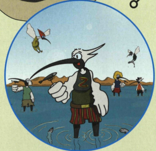
een waaiër aan eten voor tal van vogels