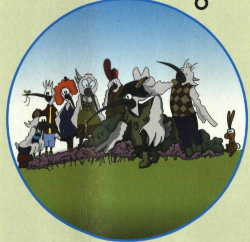
met de gids op stap in het Zwin op zoek naar tal van bijzondere planten en dieren