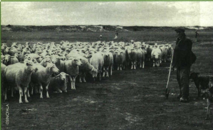
▲ de vroegere schapenbegrazing in het Zwin