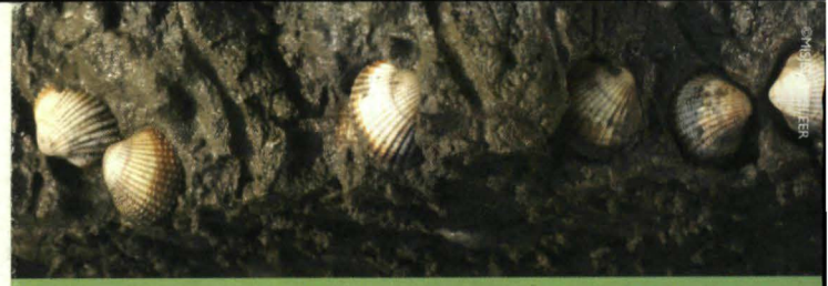
▲ broedende kokkeweenkolonie van vroege kokkels in doorsnede slik

Op basis van een gedetailleerd onderzoek zullen de verdwenen eilanden opnieuw aangelegd worden. De eilanden moeten onbereikbaar zijn voor grondroofdieren en duurzaam in stand kunnen worden gehouden. Dankzij de graafwerken zullen tal van vogels terug kunnen broeden op de nieuwe eilanden.