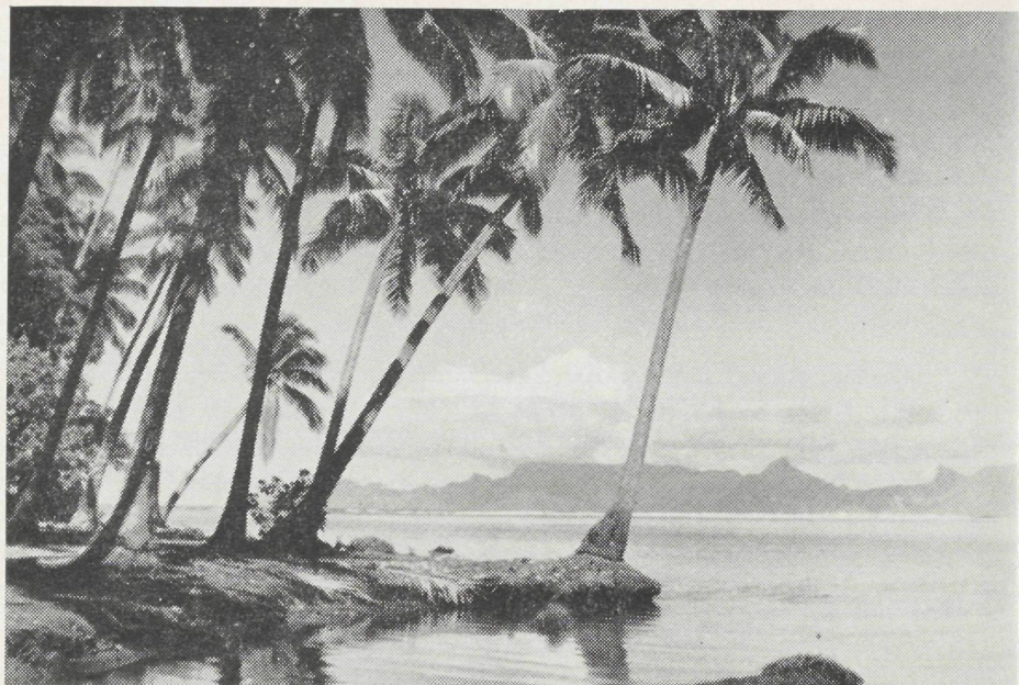
L'île de Moorea, vue de Tahiti

Parfois le récif corallien se développe sur un haut-fond, aux alentours d'un cratère volcanique immergé et prend la forme d'un anneau entourant un lagon intérieur. Il s'agit alors d'un atoll, comme à Bikini.