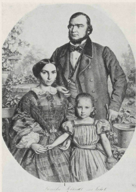
Litho nr 1: Familie Brandt aus Rostock.