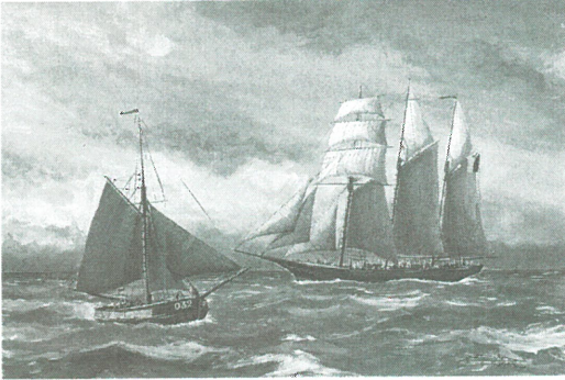
Figure 1. C. Adam, Ville d'Ostende (1968)

Parmi ces signaux, les artistes occupent une place de proue, eux qui disposent de moyens d'expression hors du commun qui leur permettent au travers de leur propre vision, de leurs sentiments, de leur perception de l'histoire et du monde, de recréer sur une toile, sur une partition ou par des plans d'architecte, les joies, les tensions, les souffrances, les découvertes, les jubilations que suscitent la nature et les hommes lorsque le passager que nous sommes, prend le temps de regarder.