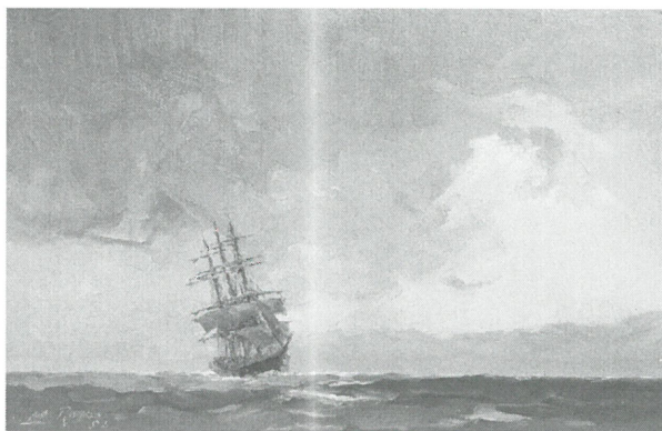
Figure 3. L. Royon, Temps de Cap Horn

Le futur Commandant Royon naît le 1 er juillet 1882 dans une famille d'armateurs de pêche ostendais. Aussi n'est-il pas étonnant que le jeune Louis passe une bonne partie de sa jeunesse sur les quais à observer les mouvements de la mer ainsi que l'entrée et la sortie des navires. Il a l'esprit libre des marins, mais il en a aussi dès le plus jeune âge le caractère bien trempé. Aussi, quand ses parents l'envoient au pensionnat à Grammont,