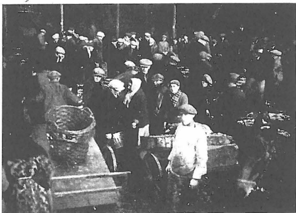
Zicht in de vischmijn te Oostende.

Daar komt het midden-onderdeel reeds op de borstwering liggen. Een vlug manoeuvre : de groote koorden komen vrij, het net wordt vastgeklampt. 't Is tijd, want in een vervaarlijke slinging raakt de boord het watervlak ; een groote golf tracht in een ruk het net weer weg te werpen.