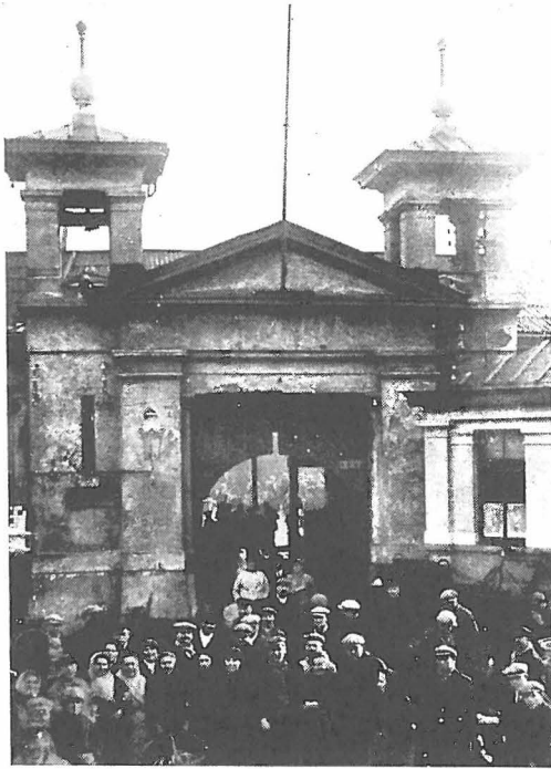
De vischmijn te Oostende.