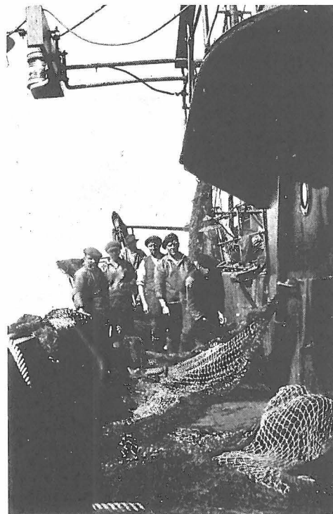
Het net moet hersteld worden.

« Stop » rinkelt het naar beneden; « Haal aan ! » en de winde draait en haalt uit volle kracht; met bruuske sprongen kapt het schip in 't water; hooge golven rollen aan en scheren langs den boord of zwalpen ineens over en doen de mannenbeelden druipen. Zij glimlachen even om het nutteloos geweld. Het achtersleepberd komt boven water en slingert rond, en bonkt geweldig tusschen zijn ophaalstangen.