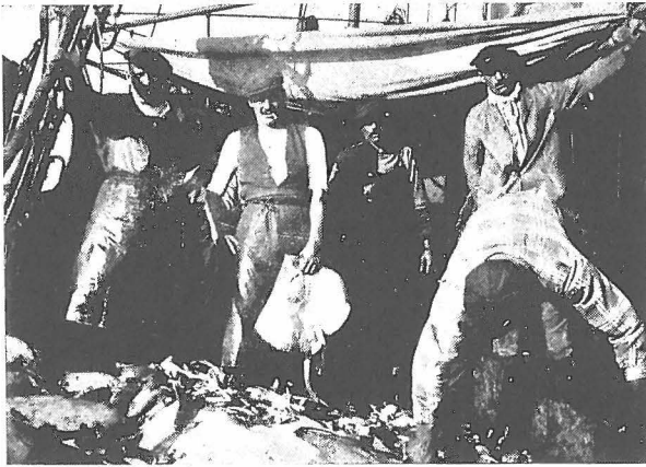
De visch ligt op het dek.

De man van de wacht gaat naar het logies der matrozen en roept uit volle longen in het nauwe, donkere, diepe gat met ijzeren trapstangen.