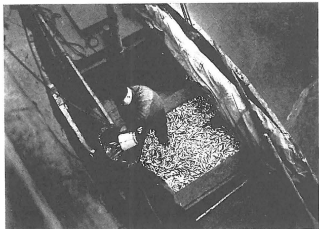
Onmiddellijk na de aankomst, wordt de vangst aan wal gebracht

Net of het leven der visschers zonder waarde is.