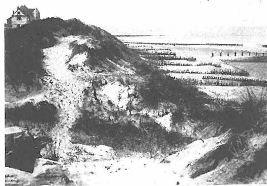
Duinen en strand te Knocke.

En is de avond heel mooi — misschien wil de maan van de partij wezen — dan gaat de zoeker naar schoonheid nog eens de duinen in, om langs de donkere riet-hompen, door groen en grauw, te wandelen over de grijze uitgestrekte zandvlakten, en om in de schemering of den maanglans de aspecten te bestudeeren van de schaduwen, die plant en mensch afwerpen. Mooie oogenblikken wachten nu den getrouwe-aan-de-natuur, vermits de stilte in haar onmetelijk veld gaat spreken, de nachtelijke rust, die tijding geeft aan eenieder. In de verte deint de zee — schichtig schiet een haasje op — af en toe pinkelt een villa-lichtje, en zoetjes aan ontwaart het oog in de donkerte een wegeltje, een tred. Als vermoeide zwervers gaat men de heuvels op — geen voetstappen worden gehoord ;