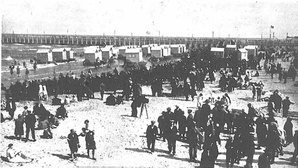
Ach, wie zag al niet zoo'n strandje aan op Zondag ! Arme lui, wat is uw hart arm !

Dat men deze dagverdeeling dan maar eens verfilme ! Nou ! er is kans voor, dat er aldra geen plekje meer overblijft van 't vrije land !