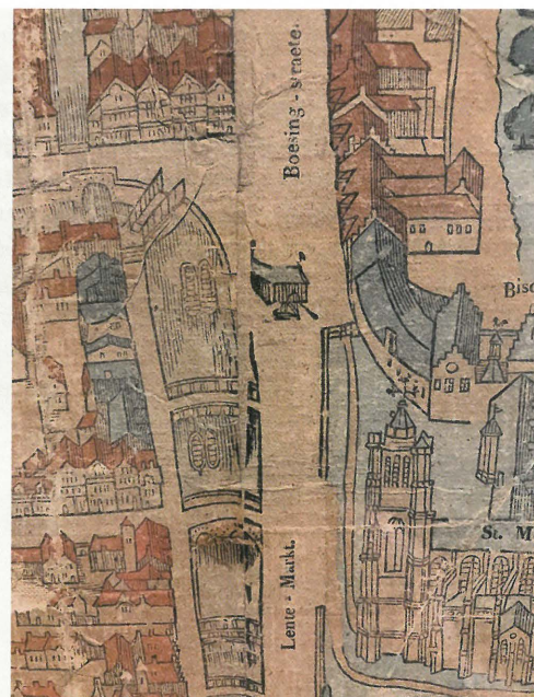
Fragment van de historische wandkaart Thevelin-Destreez van de stad Ieper uit 1564

put van noord naar zuid in tweeën deelde. Op basis van de ligging onder het plein, de bewaarde lengte en de oriëntatie van de muur was de interpretatie ervan geen moeilijke denkoefening: de kademuur van de verdwenen middeleeuwse haven. Ondanks het vele oorlogsgeweld dat de stad onderging tijdens de eerste wereldoorlog, bleek deze muur weinig tot niet beschadigd te zijn. De muur werd tot op de fundering vrij gelegd en de opbouw in detail bestudeerd. Een afwisseling van baksteen onderaan en natuursteen op een hoger niveau zorgde voor een uniform en visueel impressionant beeld. Langs de waterzijde werd de muur over de volledige lengte geflankeerd door een rij eiken-