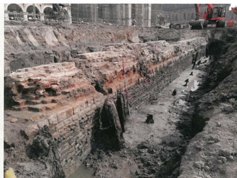
Een afwisseling van baksteen onderaan en natuursteen op een hoger niveau zorgde voor een uniform en visueel impressionant beeld