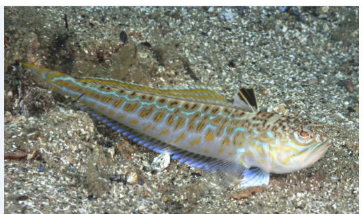
Links en midden: Kleine pieterman bij pier van IJmuiden. Rechts: Grote pieterman.