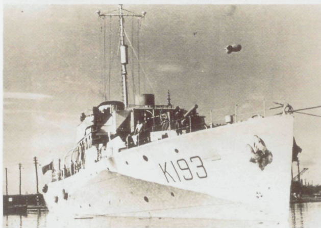
le K193 Buttercup

Le Godetia et le Buttercup terminent leur stage le 27 juin et sont affectés au service d'escorte des convois du 'Western Atlantic'.