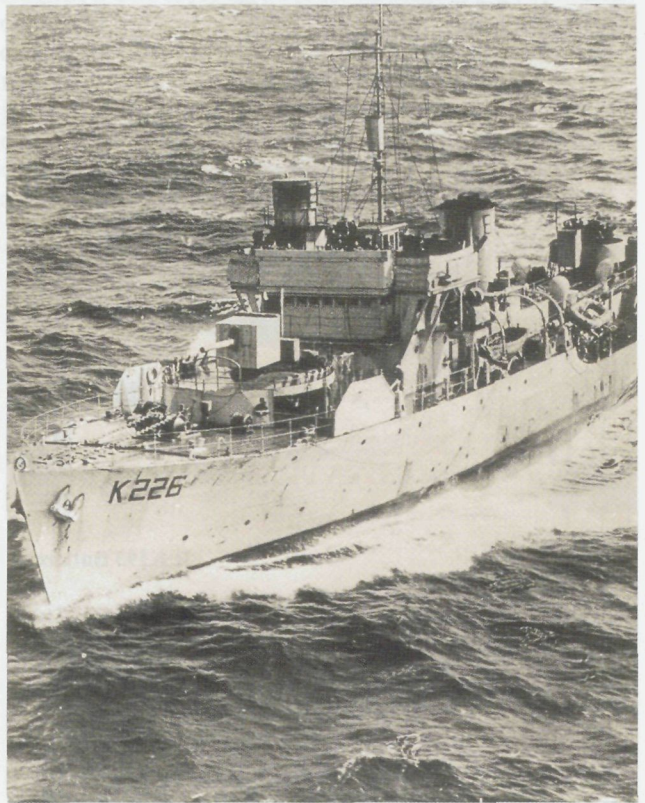
le K226 Godetia

La corvette Godetia est commissionnée en février. Le First Lord a adressé ses meilleurs souhaits au navire, ce qui a été très apprécié par l'équipage (cfr. annexe 2). L'équipage