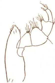
Fig. 1. — Sphaeroma (Exosphaeroma) rugicauda LEACH. Maxillipède.

Le meilleur caractère distinctif est celui des maxillipèdes. Ceux-ci, par le fait de présenter des articles élargis, font rentrer Sphaeroma rugicauda LEACH. dans le genre — ou mieux dans le sous-genre — Exosphaeroma , créé par STEBBING (!), en 1900, pour Sphaeroma gigas LEACH.