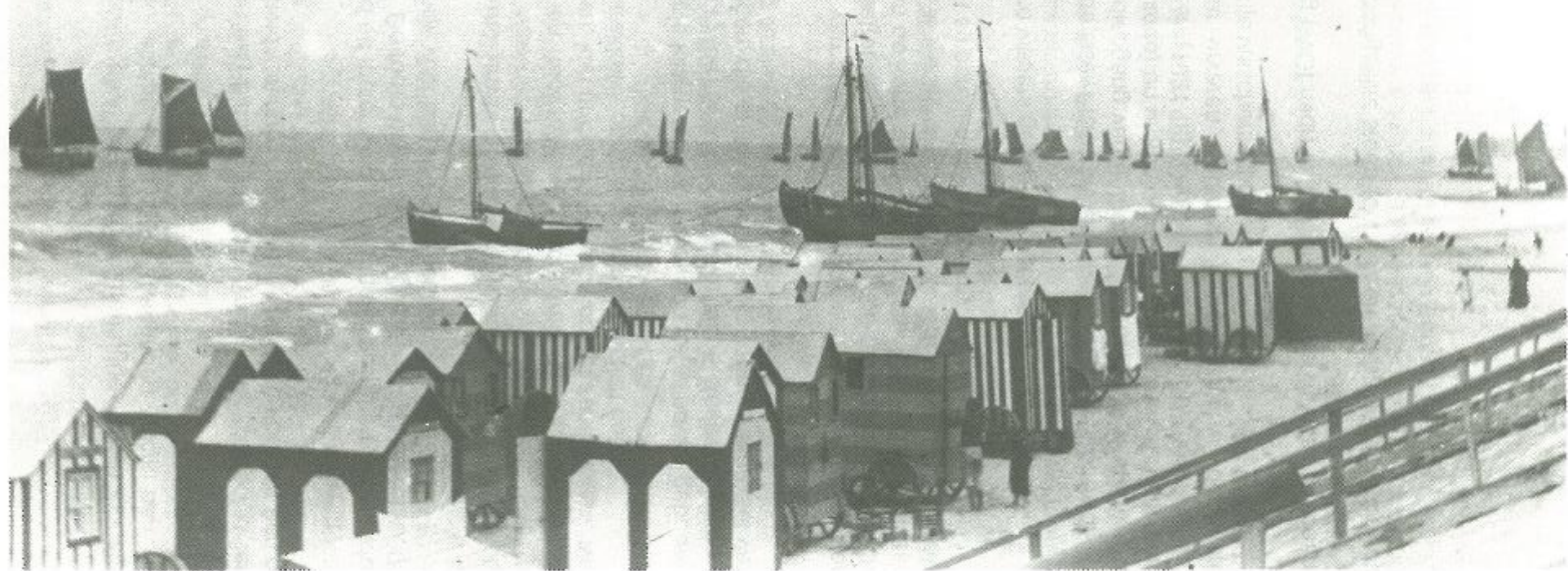
Foto Heistse vissersvloot op het strand 24 juli 1904