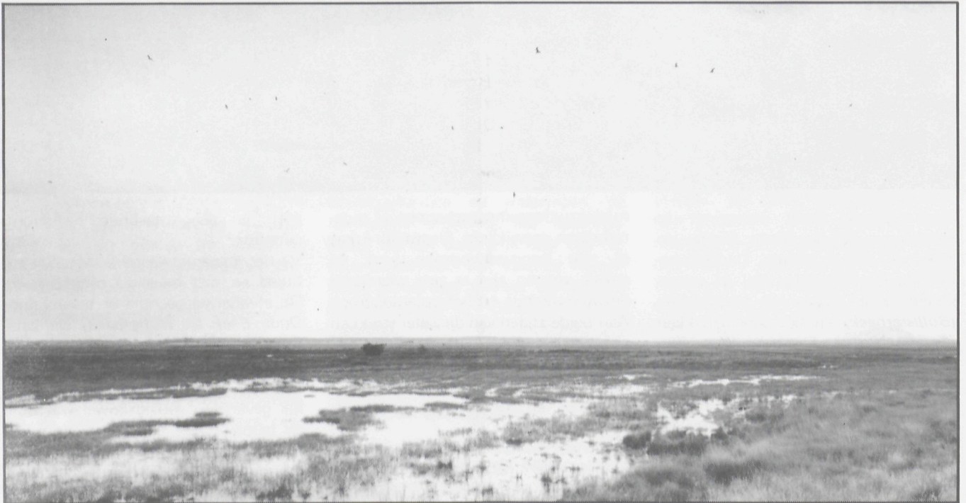
Kokmeeuwenkolonie op militair domein — verrijking voedselarme vennen — Achtergrond Terril Zolder

Ook de vennen herbergen vele van voornoemde soorten. In de diepere plassen groeit Klein Blaasjeskruid. Ook Kleine en Kleinste Egelskop werden reeds aangetroffen.