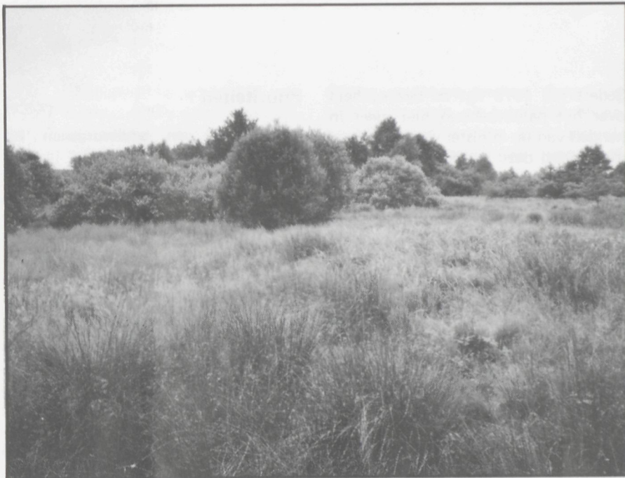
Reservaat vóór beheerswerken – verruiging en wilgenopslag

handelingen gevoerd met het oog op het beheer van waardevolle terreinen. Maar bescherming alleen volstaat niet; er moet ook gewerkt worden. Gedurende dit jaar worden, in samenwerking met Beringse jeugdverenigingen, enkele beheerskampen georganiseerd. Vele oude hooilanden zullen voor het